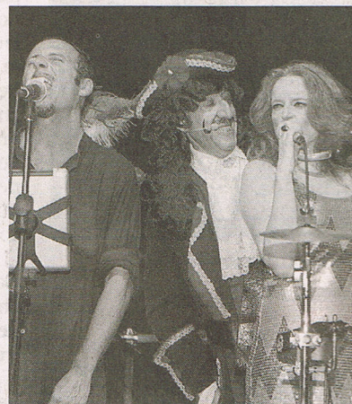
Lo show Gli imprenditori per caso